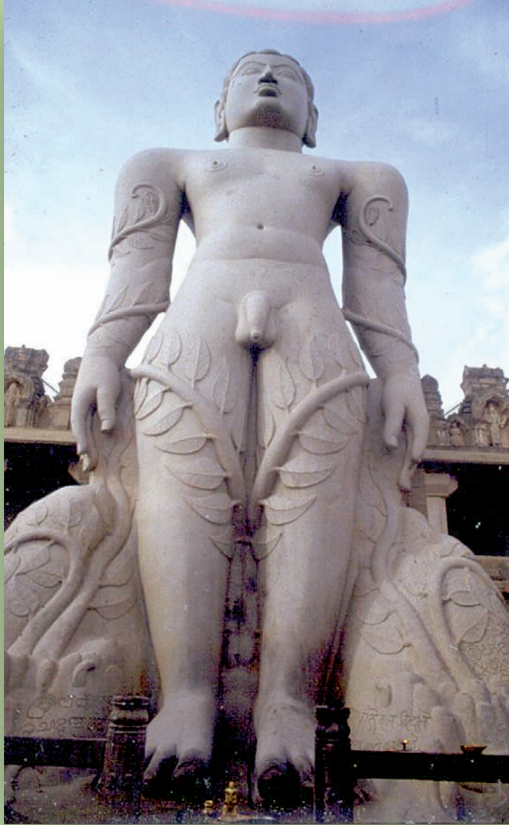
શ્રવણ બેલગોડામાં બાહુબલિની મૂર્તિ

આમને આમ એક વર્ષ પસાર થઈ ગયું. પણ તેમને કેવળજ્ઞાનની પ્રાપ્તિ ન થઈ કારણ કે અભિમાન છોડ્યા વગર કેવળજ્ઞાન થાય નહિ. તેમને સાચા રસ્તે લાવવા માટે આખરે ભગવાન ઋષભદેવે બ્રાહ્મી અને સુંદરીને મોકલ્યાં. તેઓએ જોયું તો બાહુબલિ એક ખડક જેમ અચળ ઊભા ઊભા ધ્યાન કરી રહ્યા છે. બંને બહેનોએ શાંતિથી બાહુબલિને સમજાવ્યું કે હાથી પર સવાર થવાથી કેવળજ્ઞાન પ્રાપ્ત ન થાય. તે માટે તો નીચે ઉતરવું પડે. બહેનોનો પરિચિત અવાજ કાને પડતાં જ તેણે આંખો ખોલી. તે હાથી પર તો બેઠા જ હતા નહિ. ઘડીવાર તો તેમને બહેનોની વાત સમજાઈ નહિ પછી તેમને ખ્યાલ આવ્યો કે અભિમાન રૂપી હાથીની આ વાત છે. તરત જ મનમાંથી અભિમાન કાઢી નાંખ્યું અને ભગવાન ઋષભદેવ પાસે જઈ ૯૮ નાના ભાઈઓને વંદન કરવાનું વિચાર્યું. હવે અભિમાન ઓગળી ગયું. અને નમ્રતાએ તેનું સ્થાન લીધું. કેવળજ્ઞાનની તરત જ પ્રાપ્તિ થઈ અને તેઓ સર્વજ્ઞ બન્યા. દ્વિગંબર પરંપરા પ્રમાણે આ યુગમાં સંસારથી મુક્તિ મેળવનારા બાહુબલિ પ્રથમ હતા. (શ્વેતાંબર માન્યતા પ્રમાણે ઋષભદેવના માતા મરુદેવીએ સૌ પ્રથમ સંસારમાંથી આ યુગમાં મુક્તિ મેળવી હતી.)