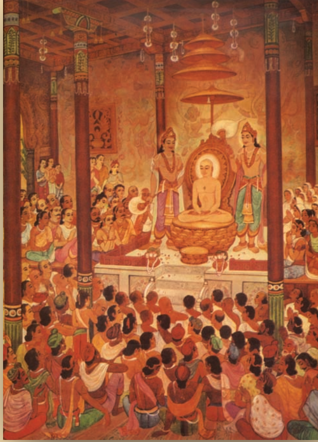
પાવાપુરીમાં ભગવાન મહાવીરનો અંતિમ ઉપદેશ

કૃપાની અપેક્ષા નહિ પરંતુ સાધક સ્વયં પુરુષાર્થ કરીને વાસના, ક્રોધ, લોભ, માન, માયા વગેરે સામે અડગપણે ઝૂઝવાનું પરાક્રમ કરે અને તેને જીતે તે જ સાચો પુરુષાર્થ.