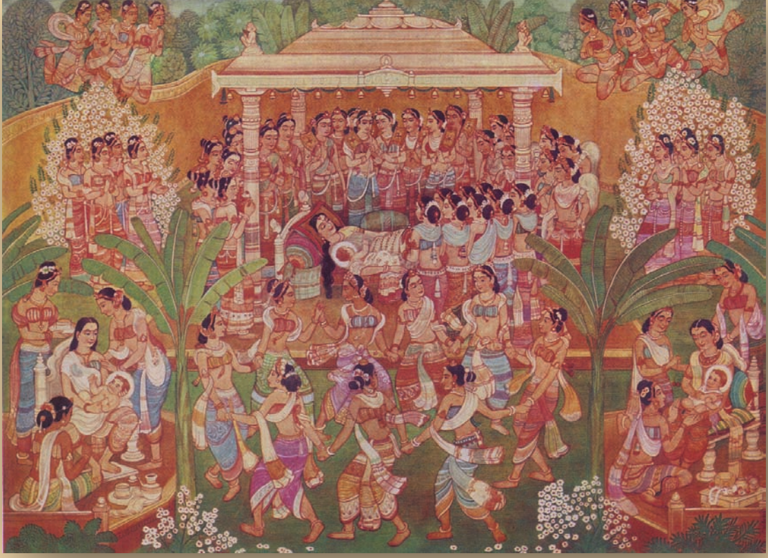
૫૬ દિક્કુમારીઓ દ્વારા ભગવાન મહાવીરનો જન્મમહોત્સવ

વૈશાલીના રાજા ચેટકનાં બહેન હતાં તથા પિતા સિદ્ધાર્થ રાજવી કુળના હતા. ભગવાન મહાવીરને નંદીવર્ધન નામે મોટાભાઈ તથા સુદર્શના નામની બહેન હતી. ભગવાન મહાવીર માતાના ગર્ભમાં હતા ત્યારથી રાજવી કુટુંબમાં સોનું-ચાંદી તથા રાજ્યમાં ધન-ધાન્યની અકલ્પિત વૃદ્ધિ થઈ હોવાથી તેમનું નામ વર્ધમાન રાખવામાં આવ્યું જેનો અર્થ 'વૃદ્ધિ' એવો થાય.