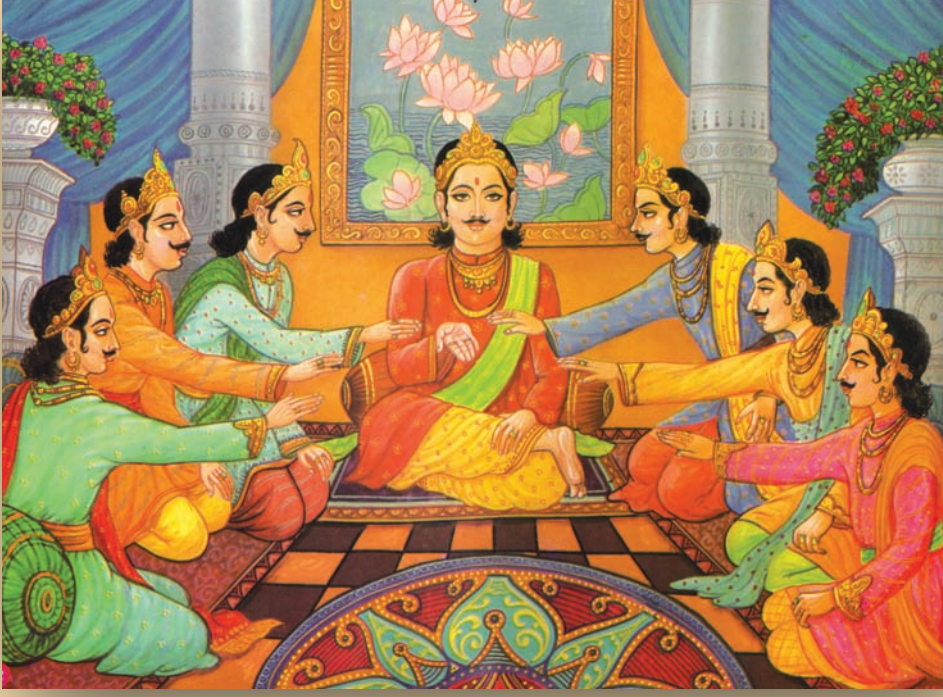
રાજકુમાર મહાબલ અને તેના છ મિત્રો

ઘણાં વર્ષો પહેલાં જંબુદ્વીપના મહાવિદેહમાં વીતશોકા શહેરમાં મહાબલ નામનો રાજા રાજ્ય કરતો હતો. તેને છ લંગોટિયા મિત્રો હતા. આ સાતેય મિત્રોની મિત્રતા એટલી ગાઢ હતી કે કોઈ કોઈને પૂછ્યા વિના કશું જ કરતા નહિ.