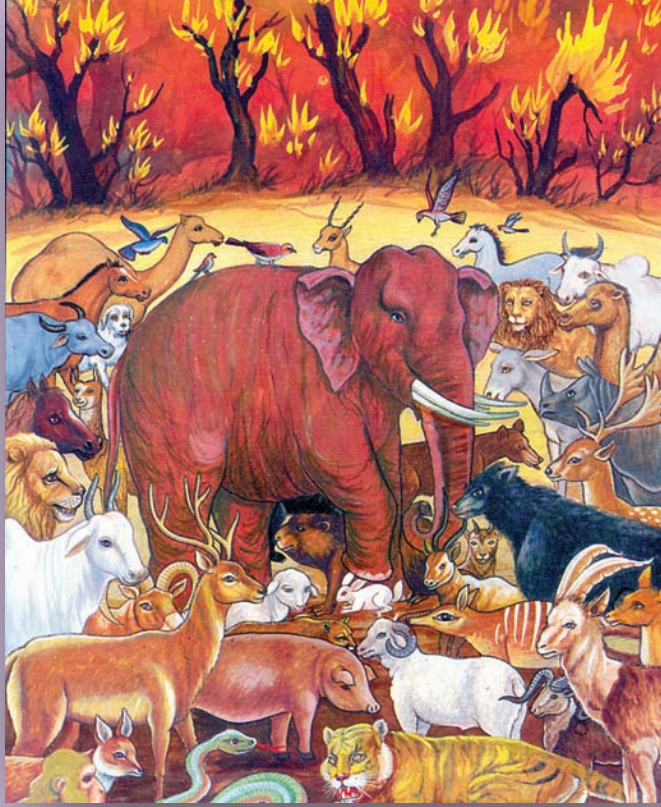
પાછલા જન્મમાં હાથીના અવતારે સસલાનો જીવ બચાવતા મેઘકુમાર

“પાછલી જિંદગીમાં તમે મેરુપ્રભ નામે હાથીઓના રાજા હતા. એકવાર જંગલમાં ભયંકર આગ લાગી હતી ત્યારે તેમાંથી તમે