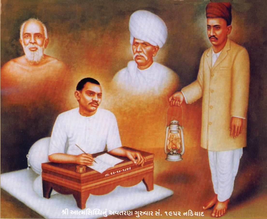
શ્રી આત્મસિદ્ધિનું અવતરણ ગુસ્વાર સં. ૧૯૫૨ નડિયાદ

અમદાવાદ પાસેના નડિયાદમાં તેઓ નિવૃત્તિ અર્થે રોકાયા હતા ત્યારે તેઓએ સ. ૧૯૫૨ ના આસો વદ-૧ ના રોજ સાંજના સમયે