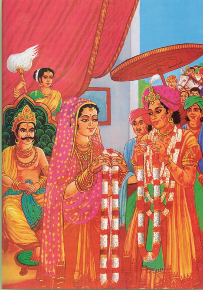
શ્રીપાલને પરણતી રાજકુમારી મયણા

મયણા ખૂબ જ ધાર્મિક પ્રકૃતિની હતી. ઉંમરરાણાના વેશમાં રહેલા શ્રીપાલને પોતાના પતિ તરીકે સ્વીકારી લીધો અને તેની સેવા