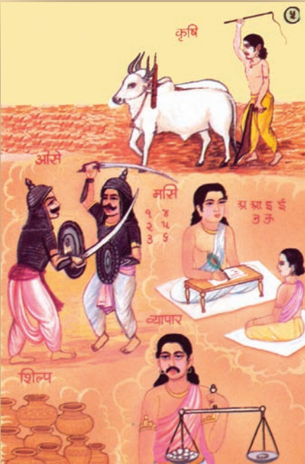
જીવન જીવવાની કળા તથા વેપાર ધંધાનું કૌશલ્ય શીખવતા ઋષભદેવ

તેઓ ટોળામાં રહેતાં. તેમના નાયકને કુલકર અથવા રાજા કહેતા. આ અરસામાં નાભિરાયા કુલકરની આગેવાનીમાં સહુ શાંતિમય જીવન વ્યતીત કરતા હતા. તેમને મરુદેવી નામની રાણી તથા ઋષભ નામનો પુત્ર હતા. ઋષભના જન્મ પછી રાજ્યમાં વસ્તીનો વધારો થયો પણ તેના પ્રમાણમાં કુદરતે સાથ ન આપ્યો. તેથી લોકોને પોતાની રોજિંદી જરૂરિયાત માટે ખૂબ જ સંઘર્ષ કરવો પડ્યો. લોકોમાં ઈર્ષ્યા અને વેરભાવ વધી પડ્યા. રાજા તરીકે નાભિરાયાએ લોકોની જરૂરિયાત પૂરી પાડવા ખૂબ જ પ્રયત્નો કર્યા. ઋષભ બહાદુર, ચતુર અને ખૂબ જ ઉત્સાહી યુવરાજ હોવાથી નાભિરાયાએ તેમના પર વિશ્વાસ મૂકી રાજ્યનો કારભાર તેમને સોંપ્યો.