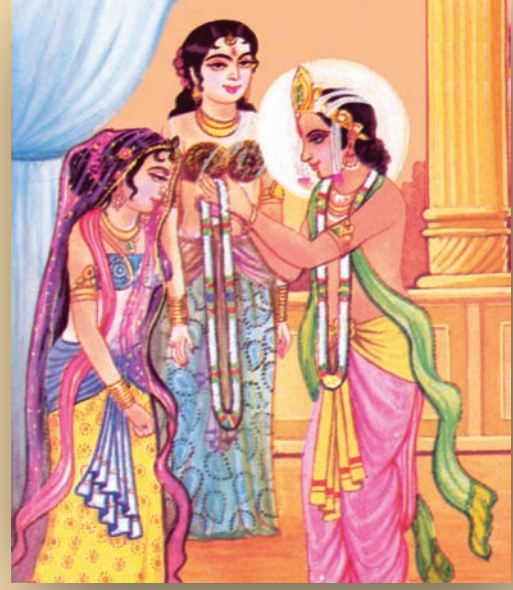
ઋષભદેવના સુનંદા અને સુમંગલા સાથે લગ્ન

ઋષભદેવને બે રાણીઓ હતી સુમંગલા અને સુનંદા. ઋષભદેવને ૧૦૦ દીકરા તથા બ્રાહ્મી અને સુંદરી નામે બે દીકરીઓ હતી. પણ સૌથી મોટા બે ભરત અને બાહુબલિ જ જાણીતા છે. આ ચાર ભાઈ-બહેન અનેક કલા ઉદ્યોગમાં પ્રવીણ હતા. ભરત બહાદુર સૈનિક અને કાબેલ રાજા હતા. એક એવો પણ મત છે કે ભારત દેશનું નામ પણ એમના નામ પરથી પડ્યું હશે. બાહુબલિ પણ નામ પ્રમાણે જ ગુણવાળા હતા.