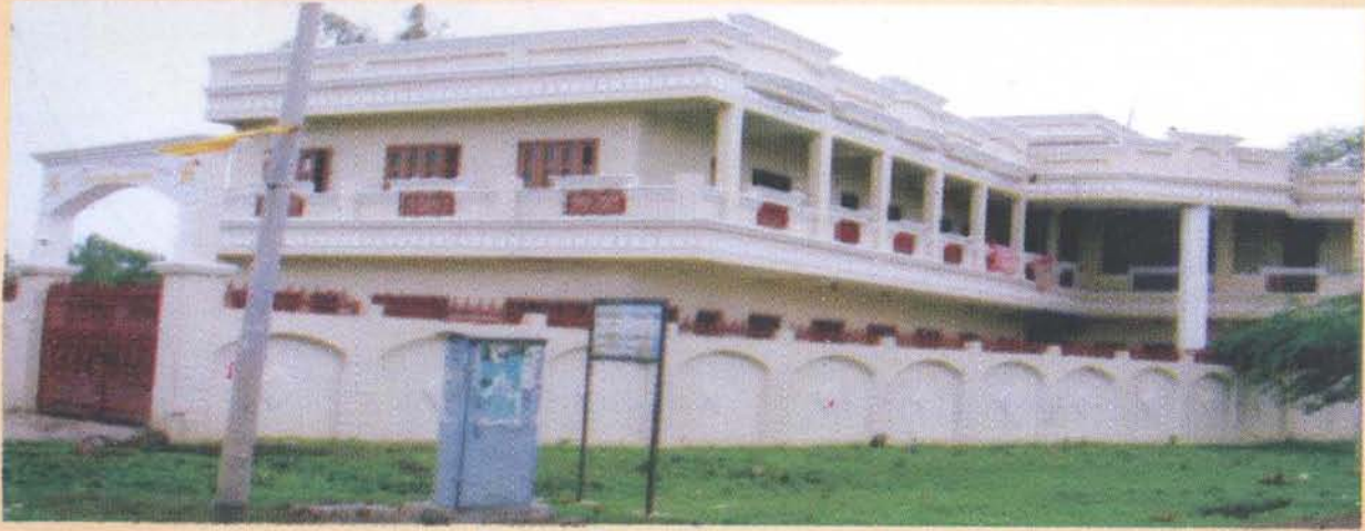
प्राच्य विद्यापीठ, शाजापुर (म.प्र.)